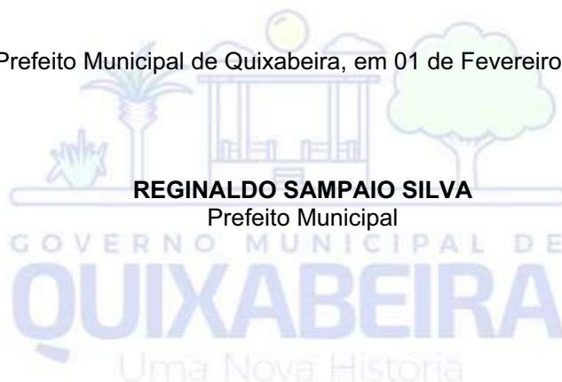
REGINALDO SAMPAIO SILVA Prefeito Municipal

Gabinete do Prefeito Municipal de Quixabeira, em 01 de Fevereiro de 2019.